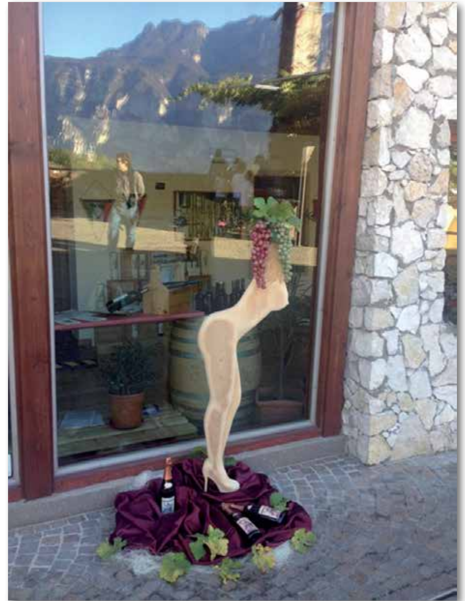
Bassorilievo sagomato nel legno - 122x44 cm c.a