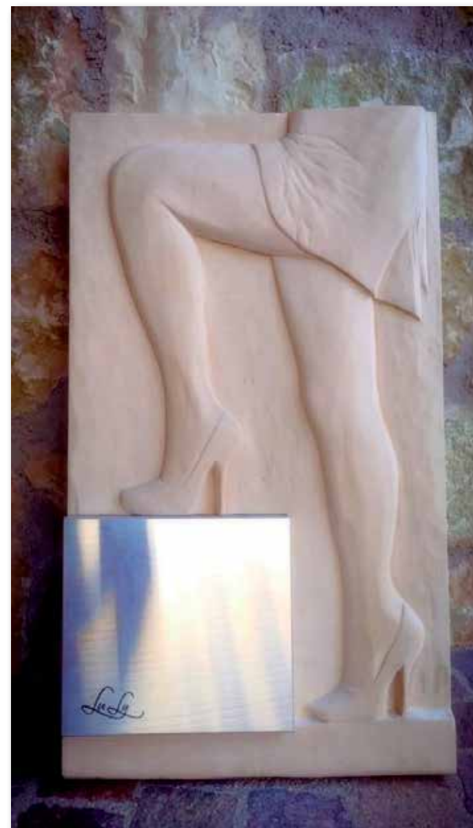
METAL AND POWER

Bassorilievo in legno - 58x33 cm c.a • inserto in lega di alluminio